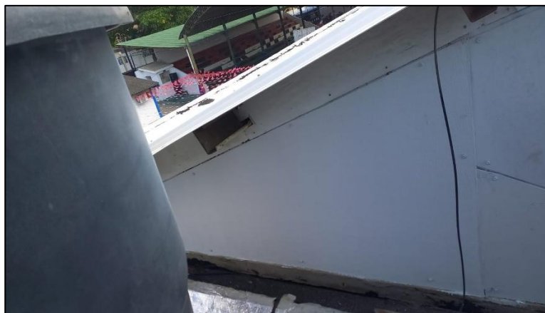
Ilustración 22: Instalación eterboard salón 2do piso