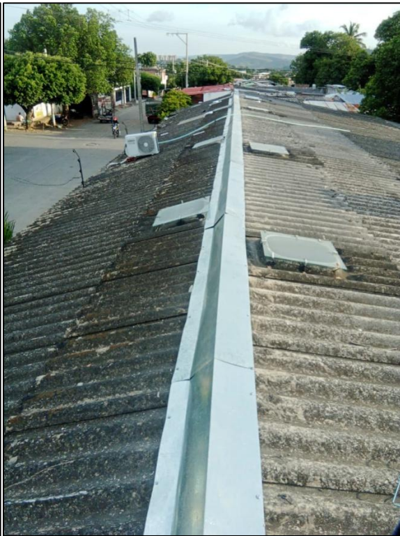
Ilustración 15: Instalación caballete