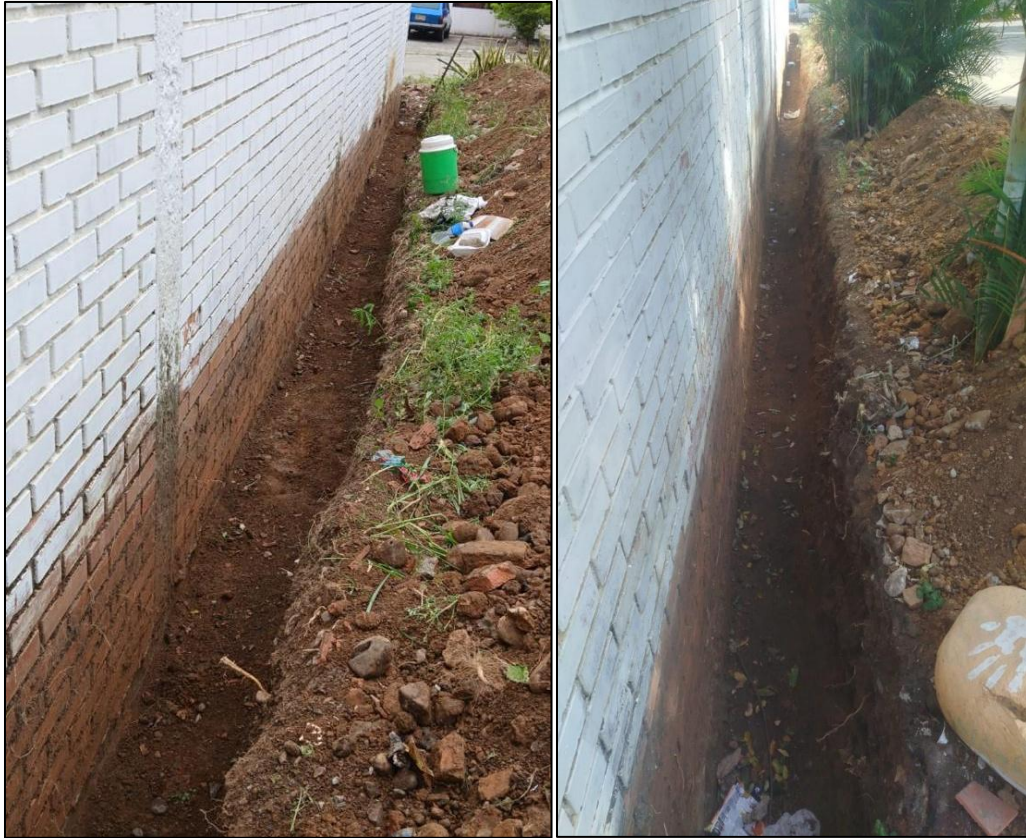
Ilustración 16: Excavación dren filtro frances