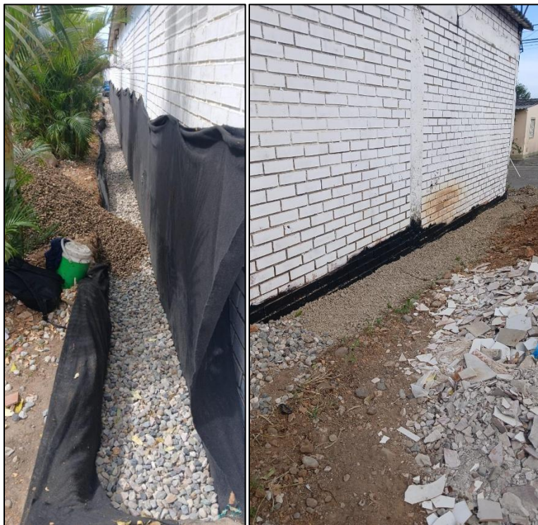
Ilustración 19: instalación de segunda capa de triturado y arena