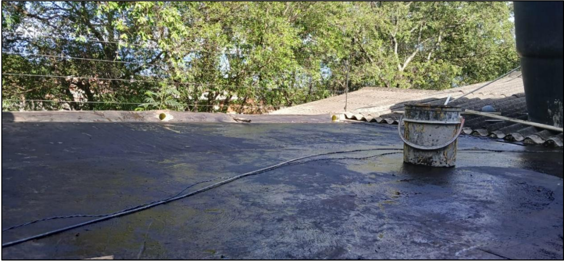
Ilustración 2: Aplicación de impermeabilizante en placa