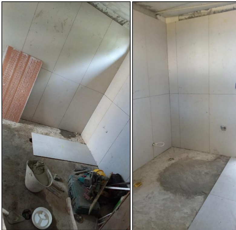
Ilustración 7: Instalación de cerámica cuarto deposito