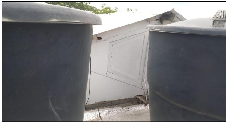
Ilustración 21: Compuerta salón 2do piso