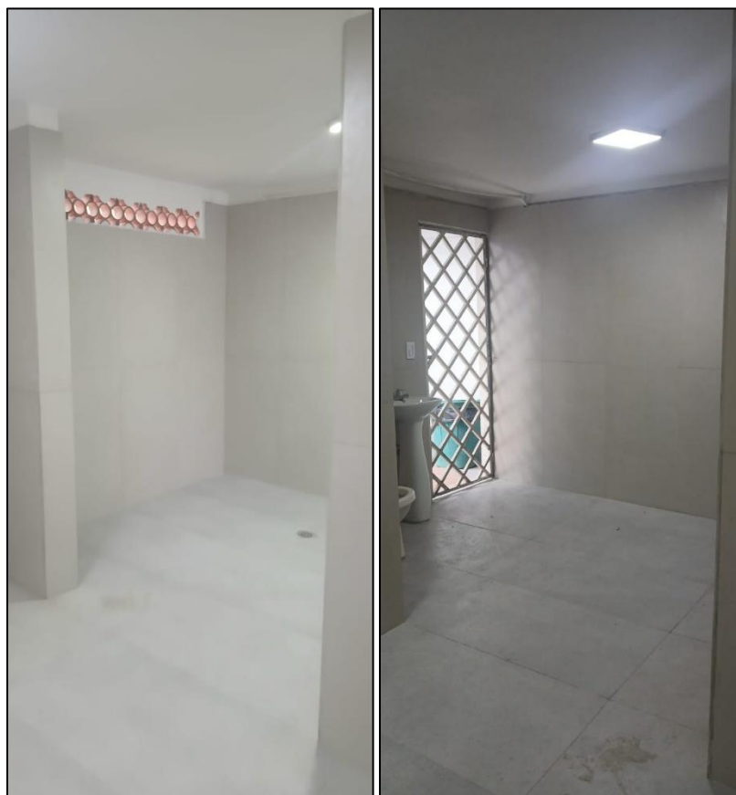
Ilustración 13: Terminación interior cuarto deposito