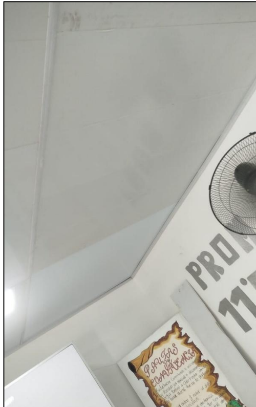
Ilustración 24: Reparación cielo raso PVC salón laboratorio