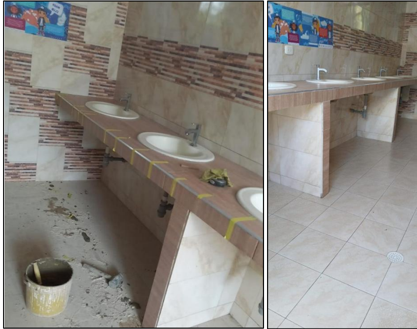
Ilustración 25: Arreglo de borde mesón baño niños