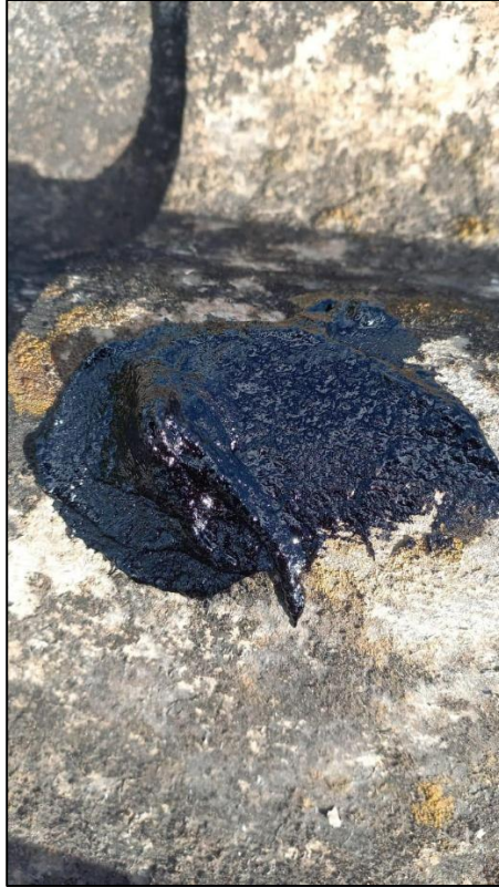
Ilustración 14: Reparación goteras cinta asfáltica