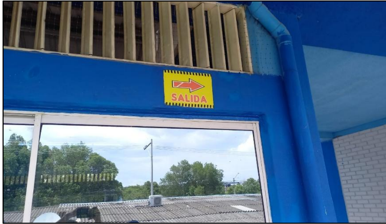
Ilustración 29: Ajuste marco ventanales de aluminio