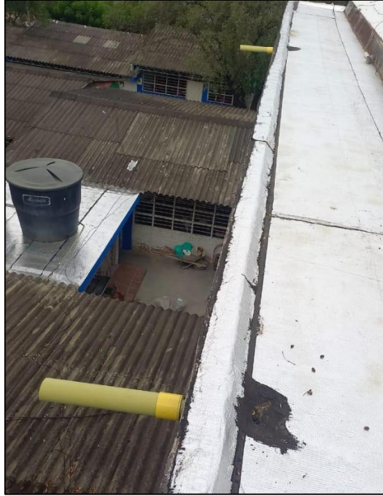
Ilustración 23: Instalación bajantes placa 2do piso