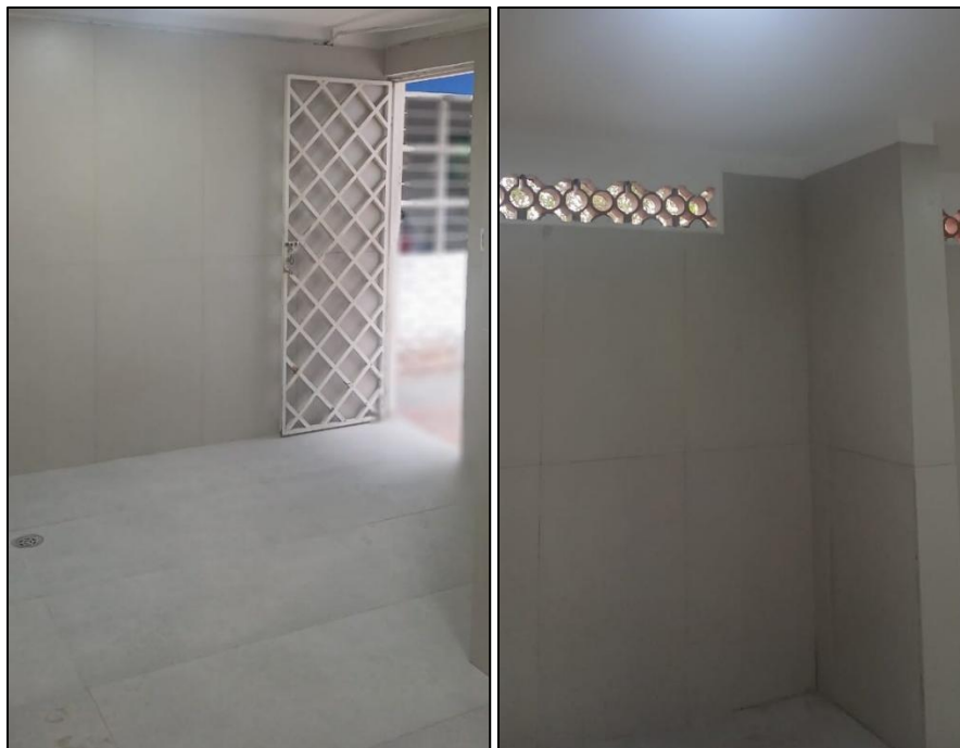
Ilustración 12: Terminación interior cuarto deposito