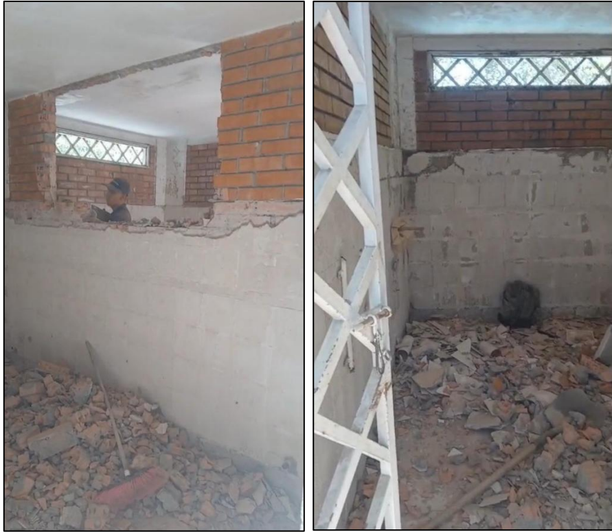
Ilustración 6: Demolición de enchape cuarto deposito