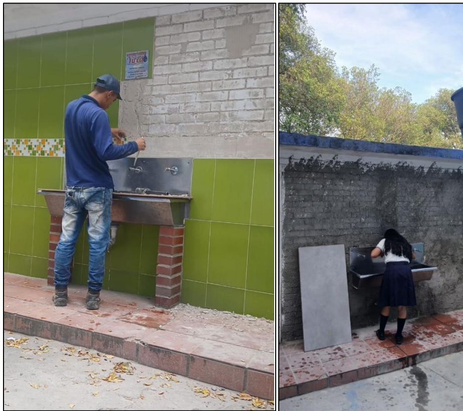
Ilustración 9: Retiro de cerámica área bebedero