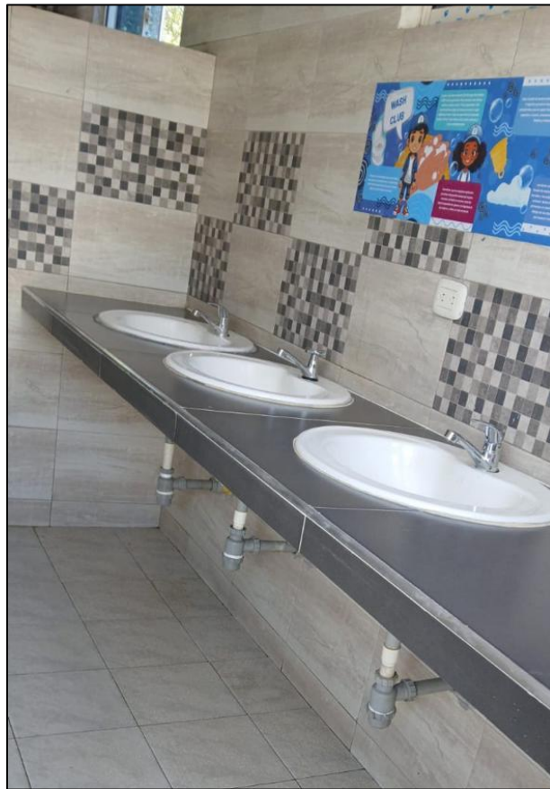
Ilustración 26: Arreglo borde mesón baño niñas