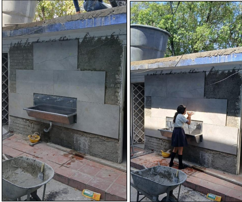
Ilustración 10: Instalación cerámica área bebederos