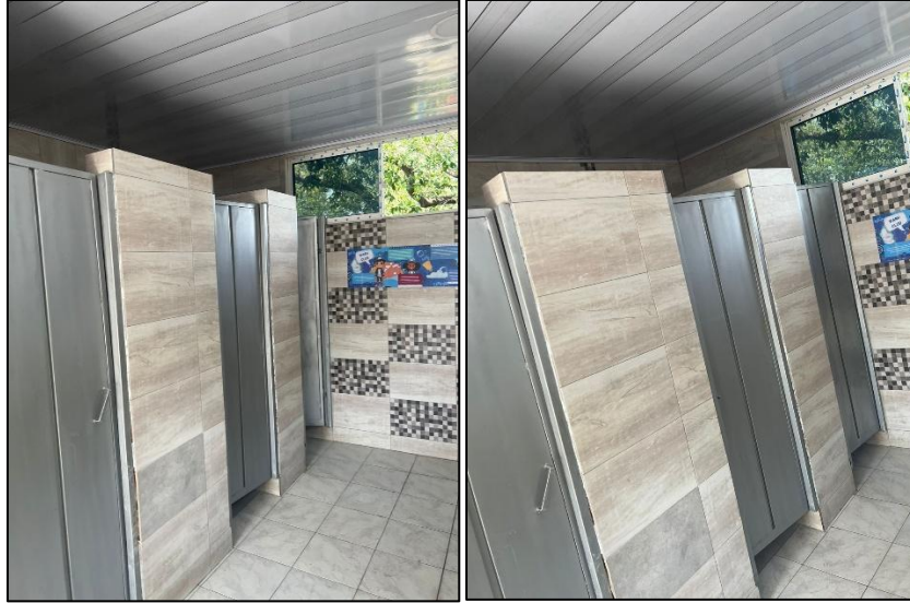
Ilustración 27: Arreglo de puertas y cubículos para sanitarios y arreglo cielo raso pvc