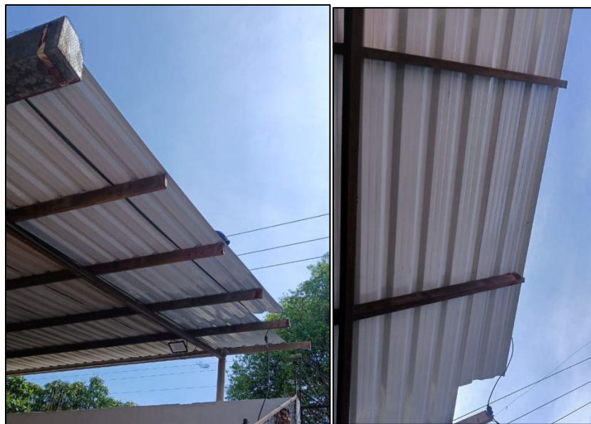
Ilustración 31: Desmonte e instalación teja arquitectónica