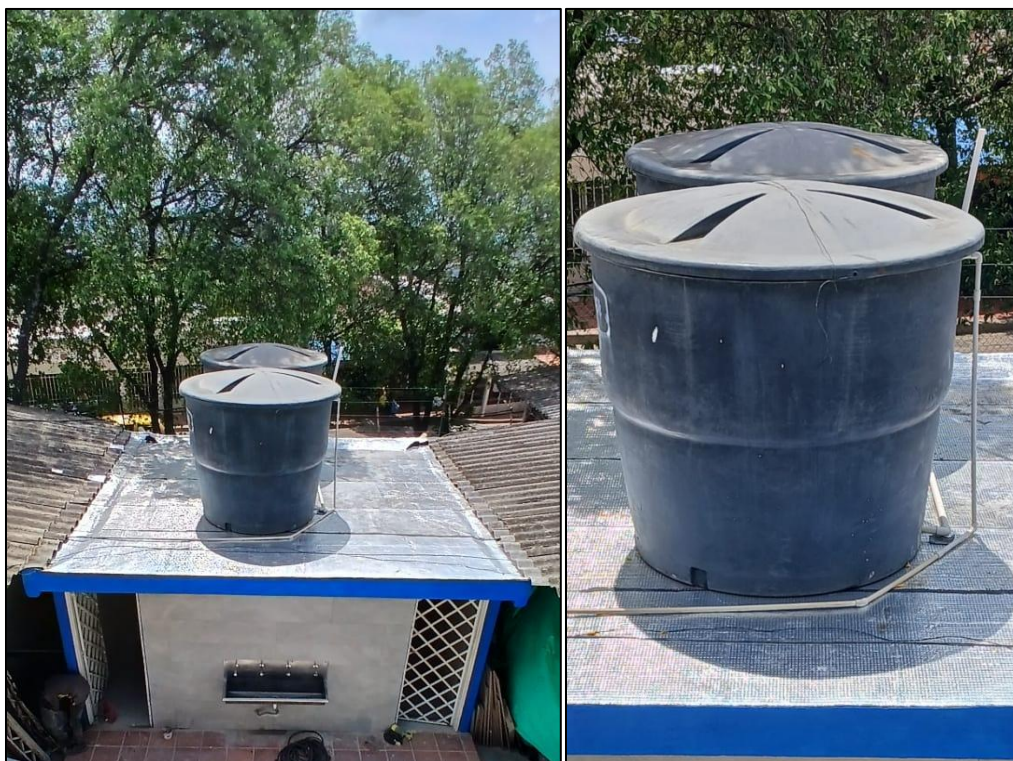
Ilustración 4: Aplicación de manto asfáltico, instalación tanques, resane y pintura de borde placa