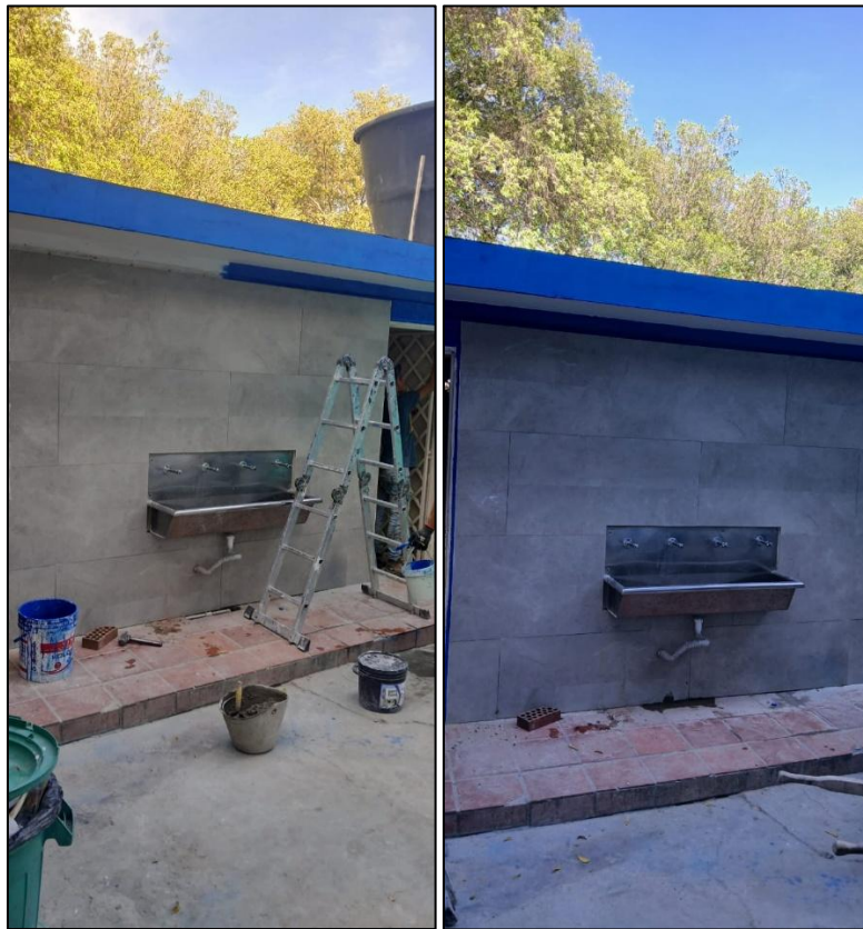
Ilustración 11: Terminaciones enchape y pintura borde