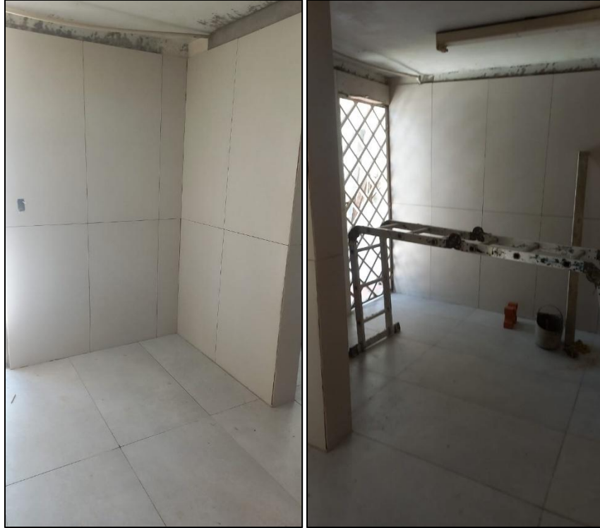
Ilustración 8: Instalación cerámica cuarto deposito