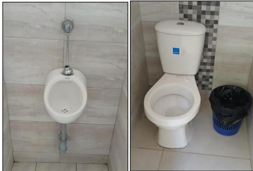
Ilustración 28: Instalación de orinales y baño sanitario