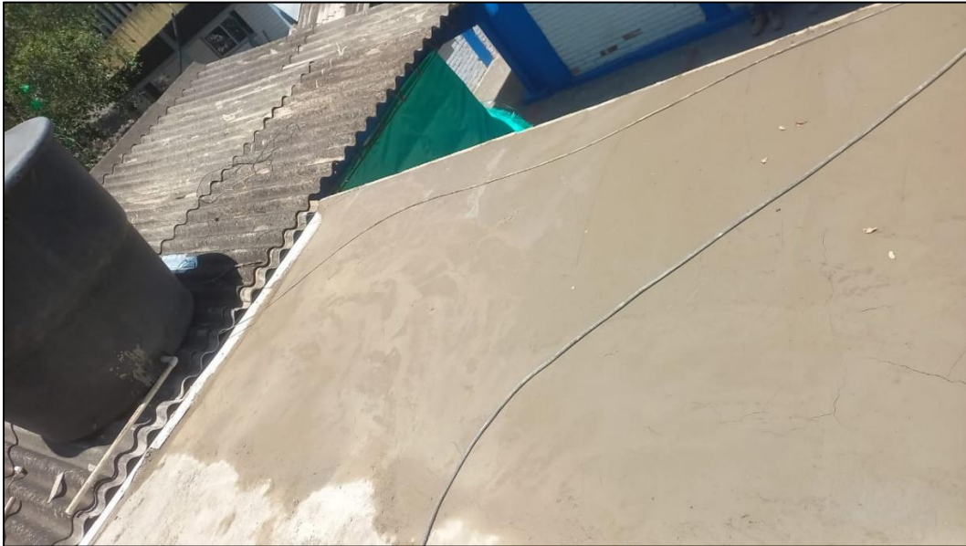
Ilustración 3: Instalación de mortero de nivelación