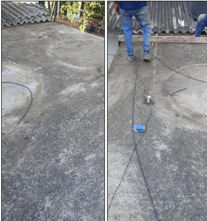
Ilustración 1: Limpieza y retiro de tanques. Cuarto deposito