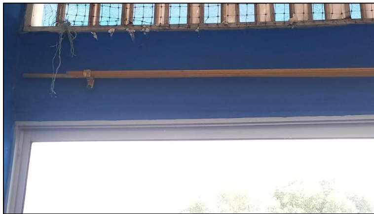
Ilustración 30: Ajuste marco ventanales