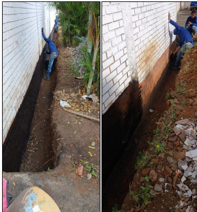
Ilustración 17: Aplicación de impermeabilizante muro dren francés