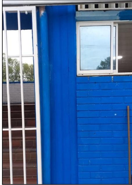
Ilustración 20: Arreglo dilatación estructural