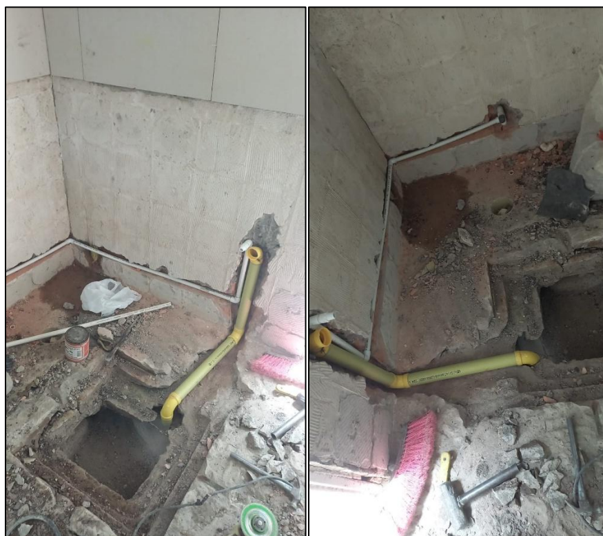
Ilustración 5: Desmonte aparatos sanitarios