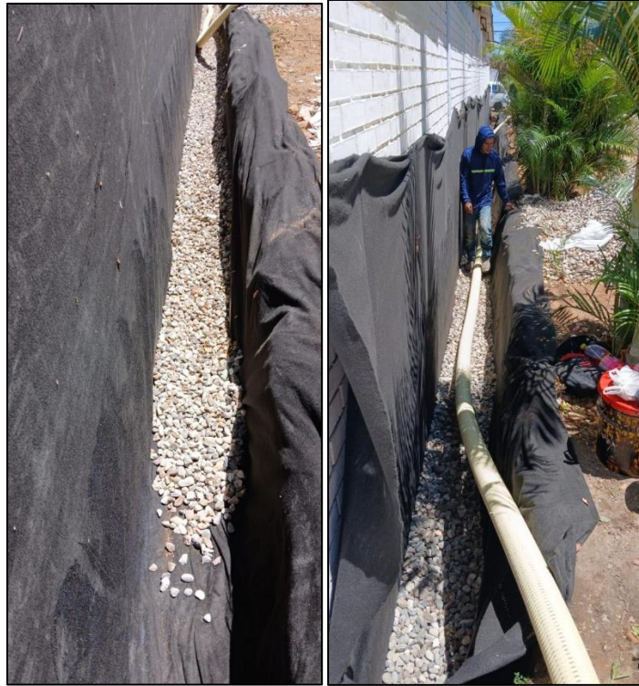
Ilustración 18: Instalación de geotextil, triturado y tubo multiperforado