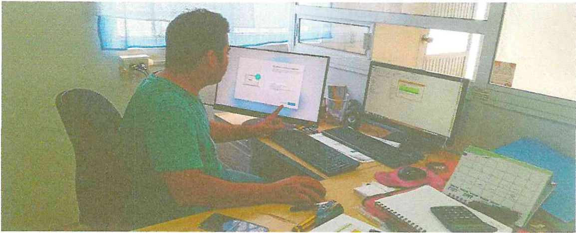
Mantenimiento impulsor cerca eléctrica sede doña nidia y sede principal