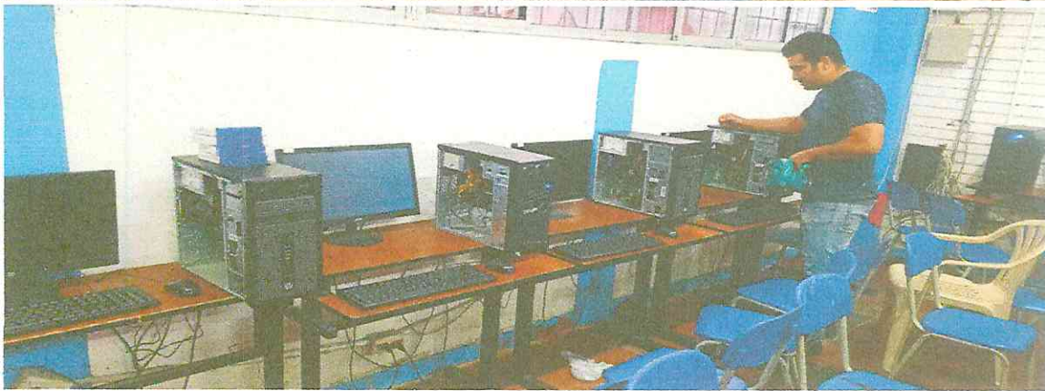
Respaldo de información de pagaduría, desmonte de equipo antiguo, instalación de nuevo equipo de pagaduría montando el respaldo e instalando impresoras.