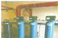
Filtro Corrector de Turbiedad